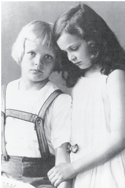
Dietrich Bonhoeffer als Kind mit seiner Zwillingsschwester Sabine

Es war ein schwerer letzter Weg, den der Gefangene am Morgen des 9. April 1945 zum Galgen antreten musste - und doch ging er ihn aufrecht und gefasst im festen Vertrauen darauf, dass dies nicht das Ende, sondern der Beginn seines Lebens bei Gott war: Dietrich Bonhoeffer, den die Nationalsozialisten kurz vor Kriegsende im KZ-Flossenbürg ermordeten. Er wird von vielen verehrt als der vielleicht einzige „Heilige“, den unsere Evangelische Kirche je ihr Eigen nannte. Dabei war ihm das Christsein nicht explizit in die Wiege gelegt worden. Als sechstes von acht