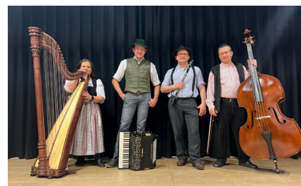
Abendmusik mit der „Hoarbergmusi“