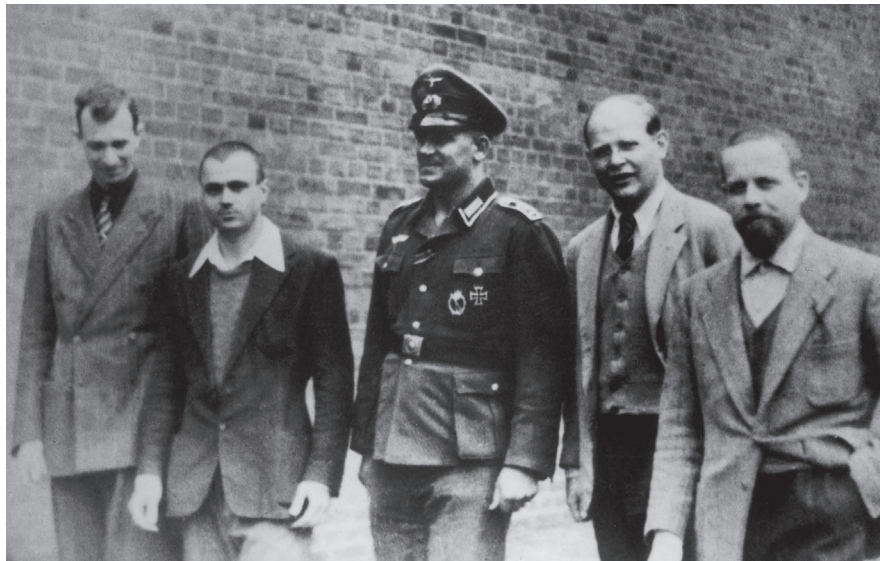
Im Gefängnishof in Berlin-Tegel 1944