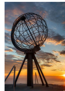
Mitternachtssonne am Nordkap

Der Vortrag besteht aus zwei Teilen. Der erste Teil umfasst den Reiseabschnitt von Deutschland bis ans Nordkap. Dabei besuchen wir die skandinavischen