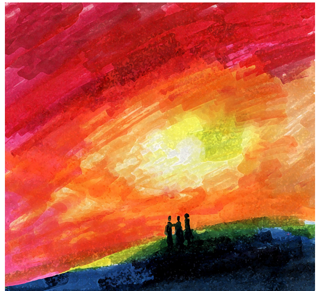
Im Licht der Auferstehung wird das Leben bunt

Dabei sind es gerade die schwierigen bis unmöglichen Umstände, für die die gute Nachricht gemeint ist, als Widerspruch gegen all das, was immer noch viel zu viele Menschen als ihre Wirklichkeit erfahren, und zwar eben nicht als ein fröhliches Weglachen dieser Umstände, sondern als ein ernstes NEIN! Gottes dagegen, dass Not, Tod, Mangel, Leid, Schmerz zwar große Ausmaße annehmen können, aber nicht Gottes Wirklichkeit sind. Und der Jubel darüber musste sich auch in der frühen Christenheit erst langsam Bahn brechen. Die Frauen, die das leere Grab entdeckten, hatte „Zit-